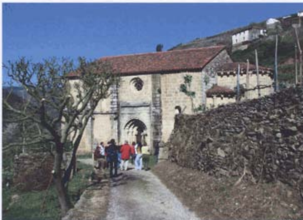
Visita á igrexa románica de Pombeiro

Por unha tortuosa estrada chegamos a Pombeiro, onde visitamos a igrexa románica, e despois de camiñar por un sendeiro á beira do Sil, chegamos ás tumbas antropomorfas do Preguntoiro, que se poden ver nunha paraxe de gran beleza. En Pombeiro os nosos visitantes disfrutaron coas moitas fontes de auga (fontes, mananciais e fervenzas).